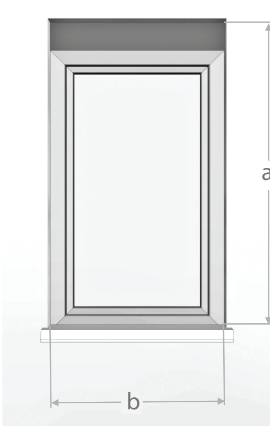
Tabla de medición para método de persiana exterior con cajón túnel de aislamiento